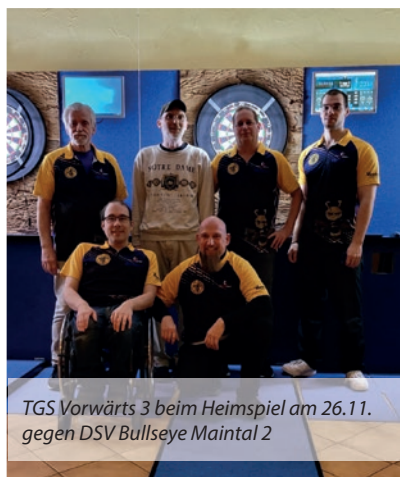
TGS Vorwärts 3 beim Heimspiel am 26.11. gegen DSV Bullseye Maintal 2