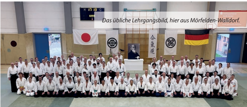
Das übliche Lehrgangsbild, hier aus Mörfelden-Walldorf.

Für 2025 wünschen wir uns neue Mitglieder, Anfängerinnen und Anfänger, Quereinsteiger oder Wiedereinsteiger sind herzlich willkommen.