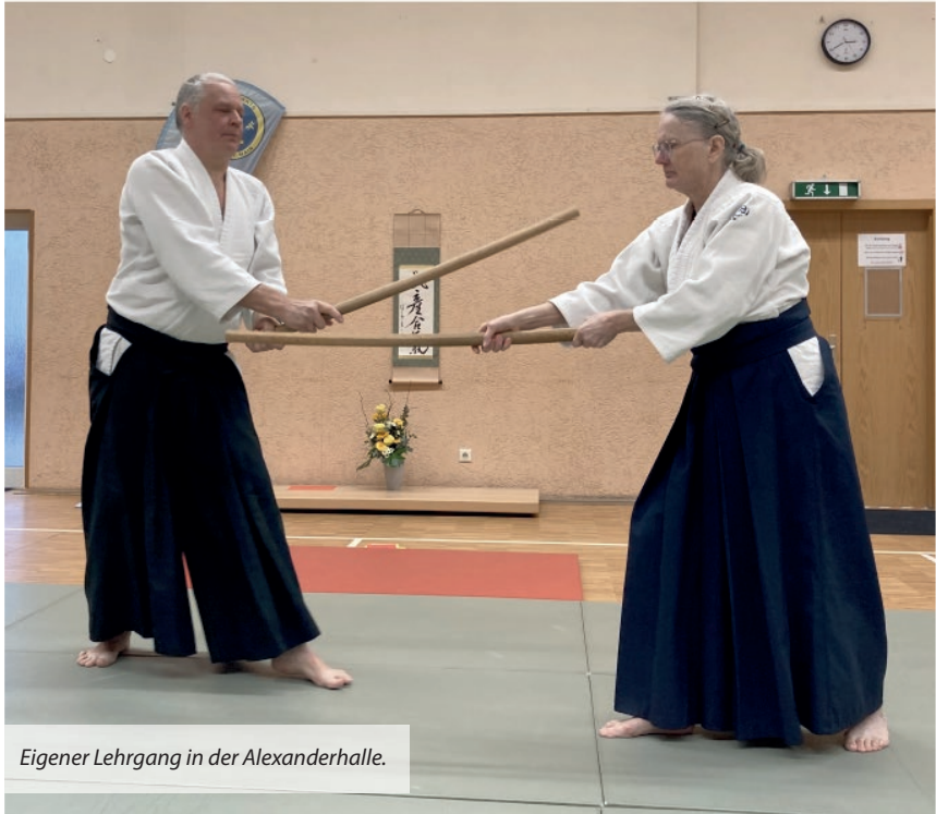
Eigener Lehrgang in der Alexanderhalle.

Allen Lesern und Leserinnen der Chaussee wünschen wir alles Gute und Gesundheit für 2025!